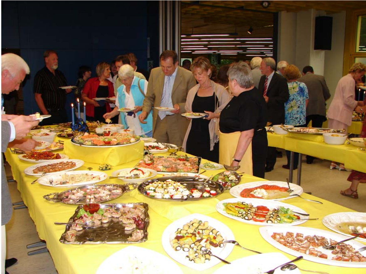
Ausklang der Verabschiedung: Ein exzellentes kaltes Buffet.