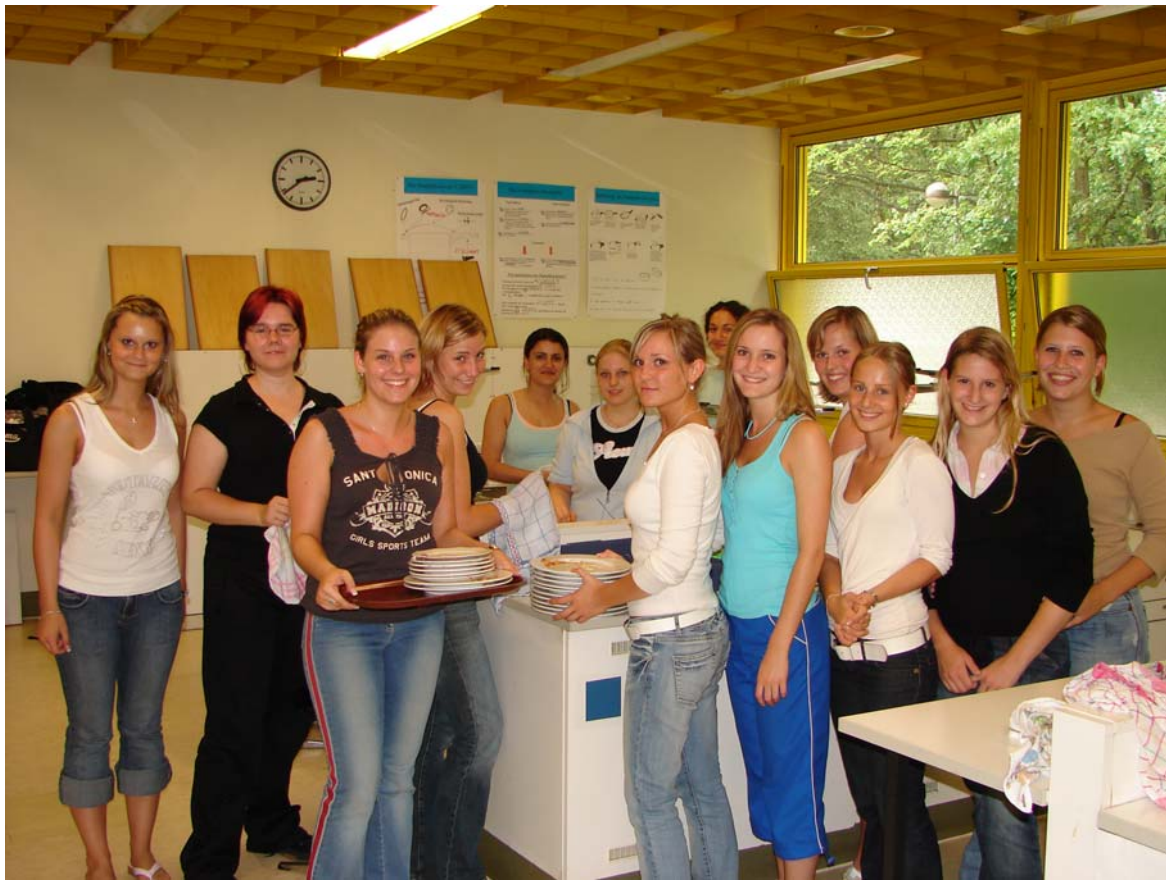
Die guten Geister im Hintergrund: Die Klasse 1 RE 1 übernahm die Bewirtung sowie den Spüldienst.